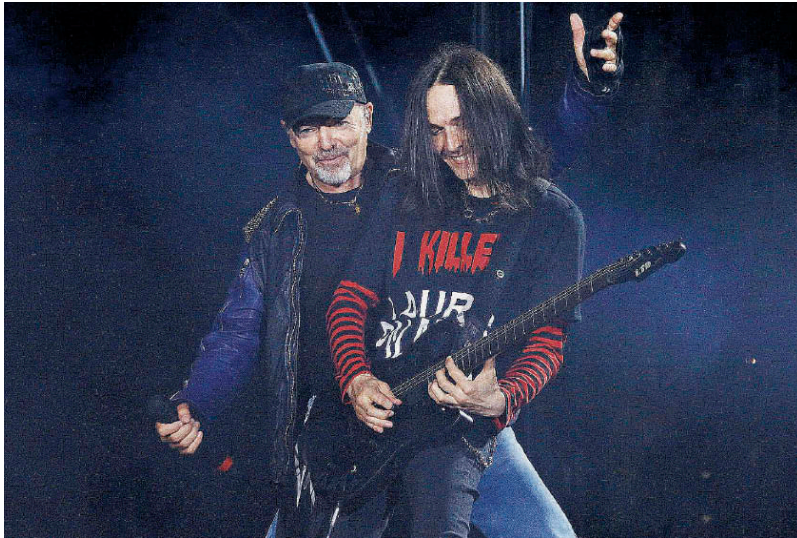
La "data zero" a Lignano Sabbiadoro. Vasco Rossi ha aperto il Live Kom '016